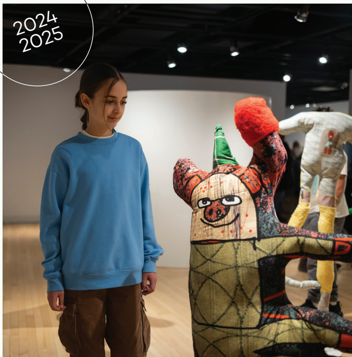
© Ressemble à personne 2023. Œuvre de Fontaine Lerroche.

Le Centre d'art Jacques-et-Michel-Auger est situé dans le Carré 150, géré par Diffusion Momentum, organisme inscrit au Répertoire culture-éducation, éligible au remboursement des sorties scolaires en milieu culturel (mesure 15186).