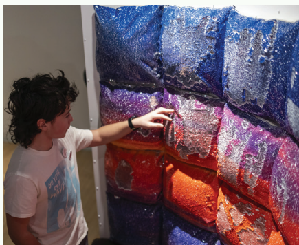
© Ressemble à personne , 2023. Œuvre de Ludovic Boney.

L'exposition est produite par le Centre d'exposition Raymond-Lasnier, géré par Culture Trois-Rivières, avec le soutien du ministère de la Culture et des Communications du Québec.