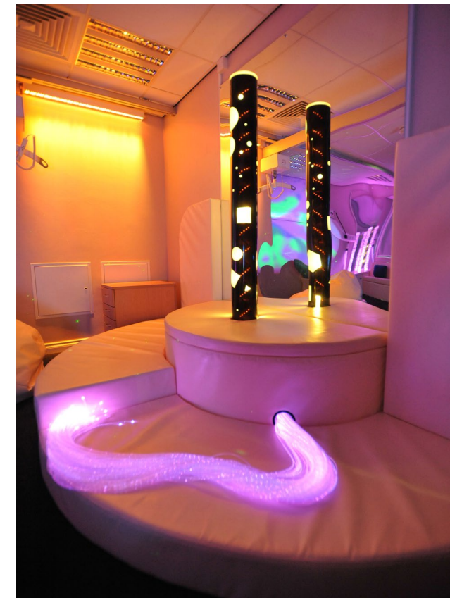
Exemple de salle Snoezelen